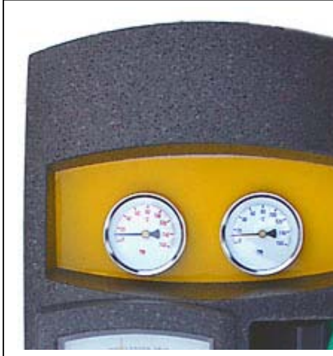
Aquasol Drivpaket DPN 18L