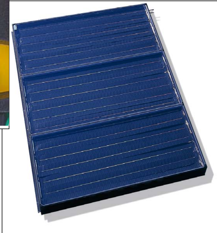
Aquasol Big 6,6 S